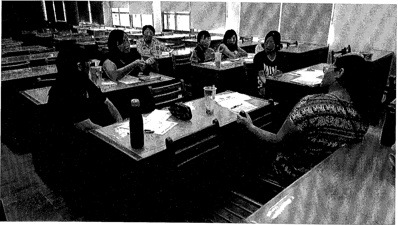
說明一、討論第一次期中考試題分析