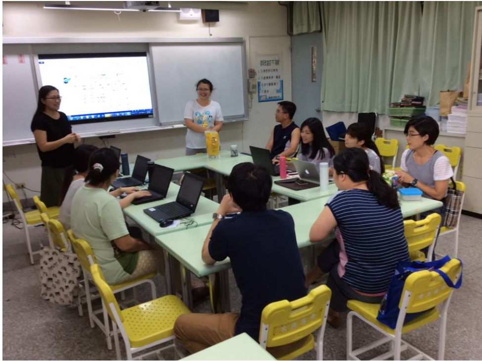
說明一、106/06/08 期末教學研究會教務處組長報告