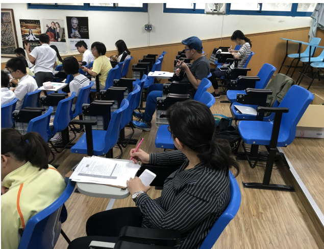
教師專業陪伴與紀錄