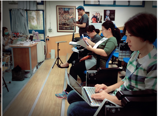
教學研究會暨議課