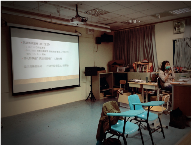
教學研究會暨說課