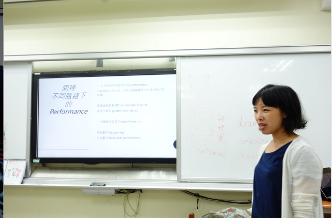
同一作品在不同場域展演的差異