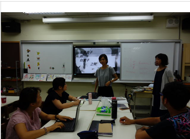
邀請者欣美老師介紹講者

莊老師視覺藝術出身，負笈歐洲留學後，大量體驗跨界合作與創作。在本次演講中，她分享了她對跨界創作的經驗，跨界創作教學的理念，以及她的創作如何在劇場展演與美術場館展覽的差異。