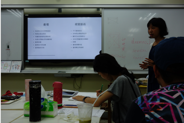
劇場展演與美術場館展覽比較