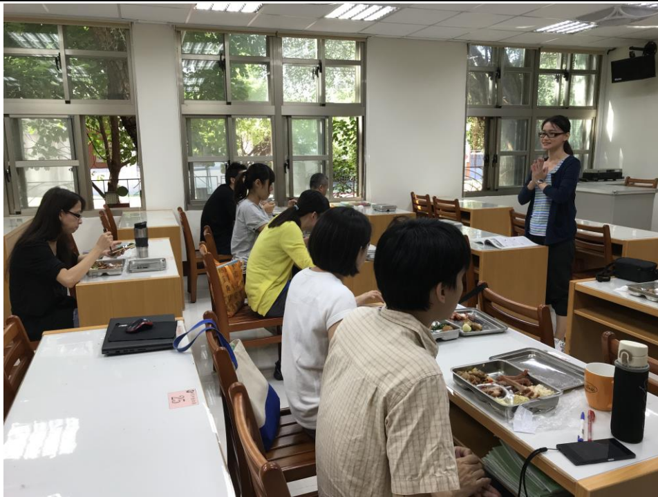
說明一、說明班級特性