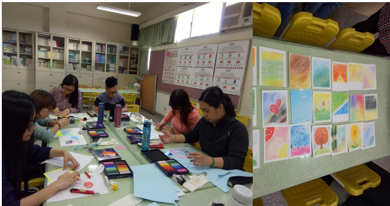
說明一、106/11/30 和諧粉彩療癒工作坊教師認真創作(左)/作品集(右)