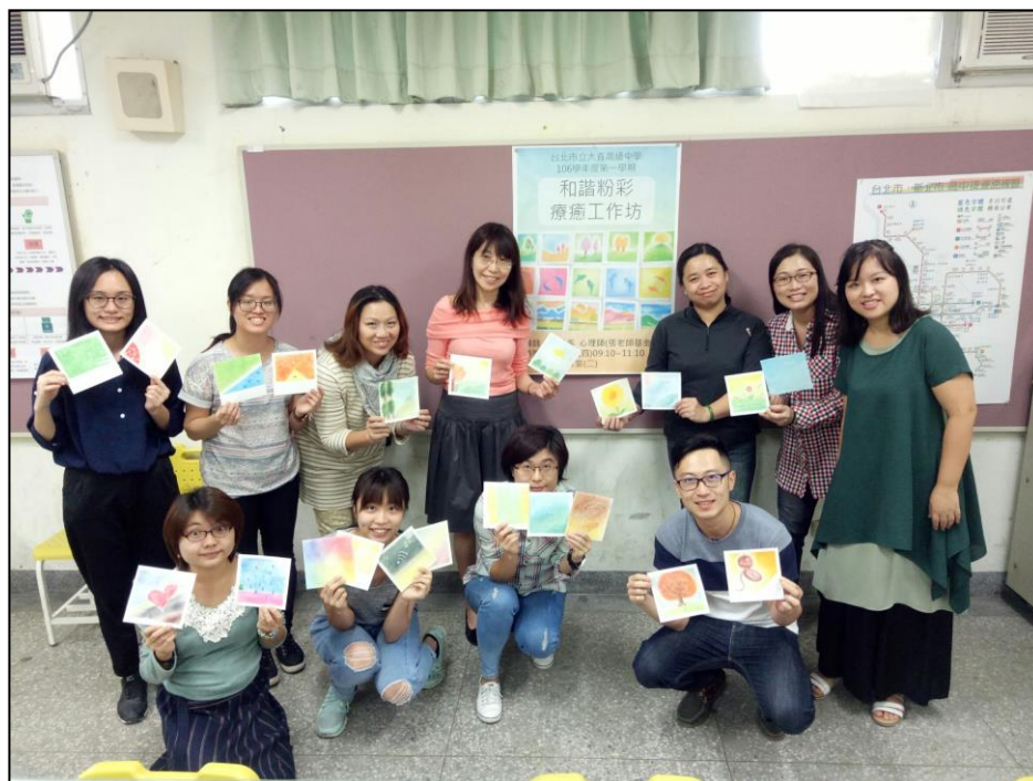
說明二、106/11/30 和諧粉彩療癒工作坊-團體合照