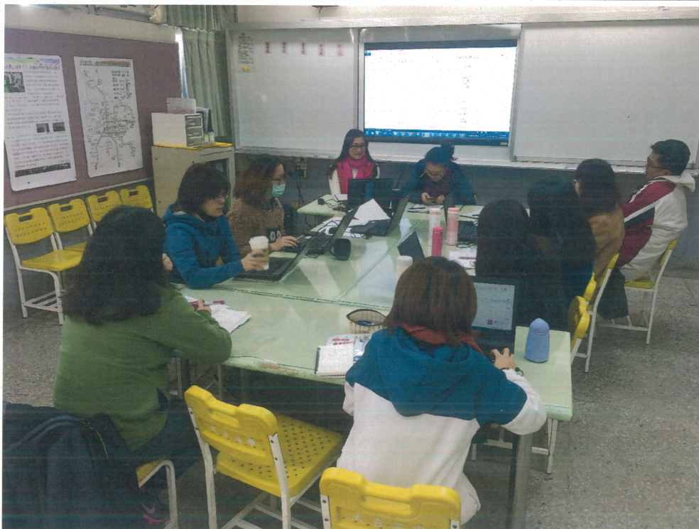
說明二、期末教學研究會參與人員(107/01/11)