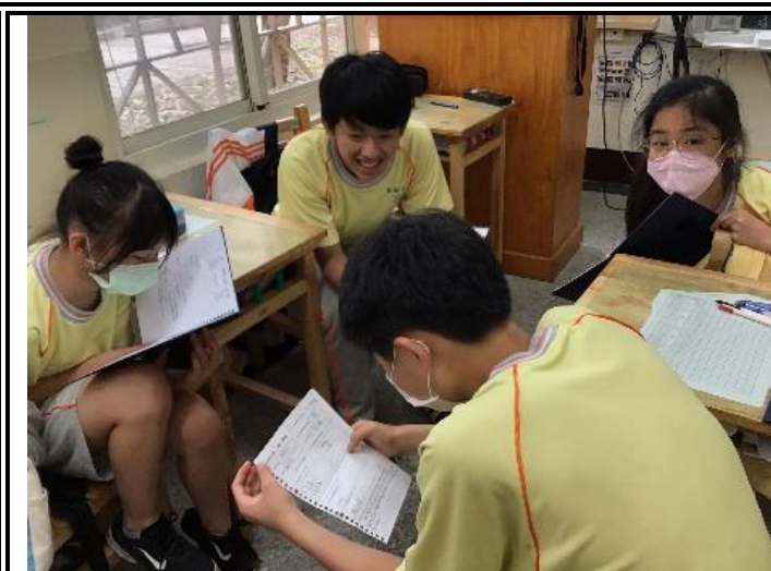
說明：學生先在小組內做分享。(706)