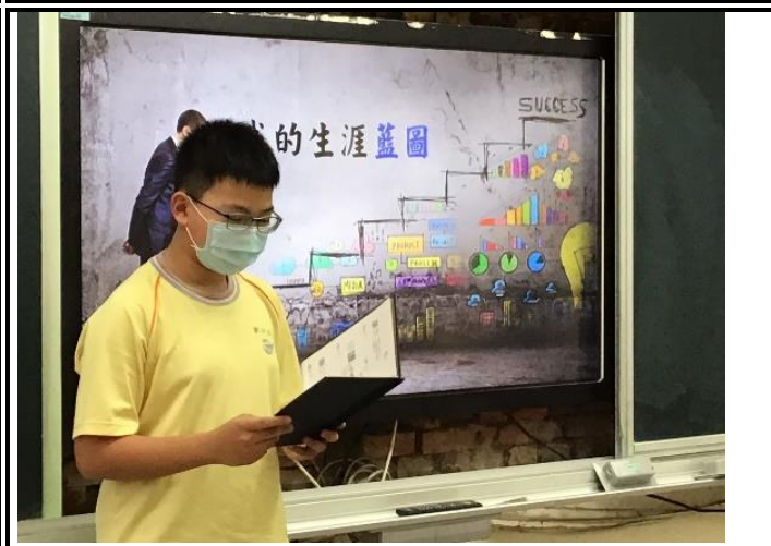
說明：學生自願上台口頭報告(702)