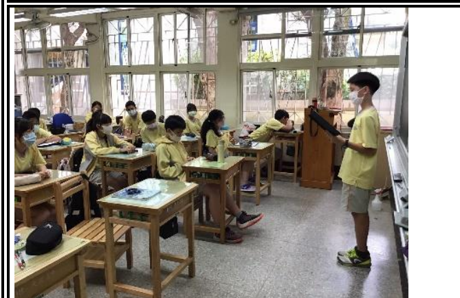
說明：學生公開分享給其他同學。(706)