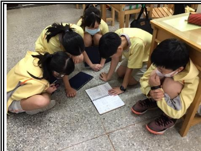
說明：學生先在小組內做分享。(706)