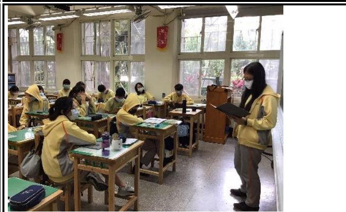
說明：學生公開分享給其他同學。(702)