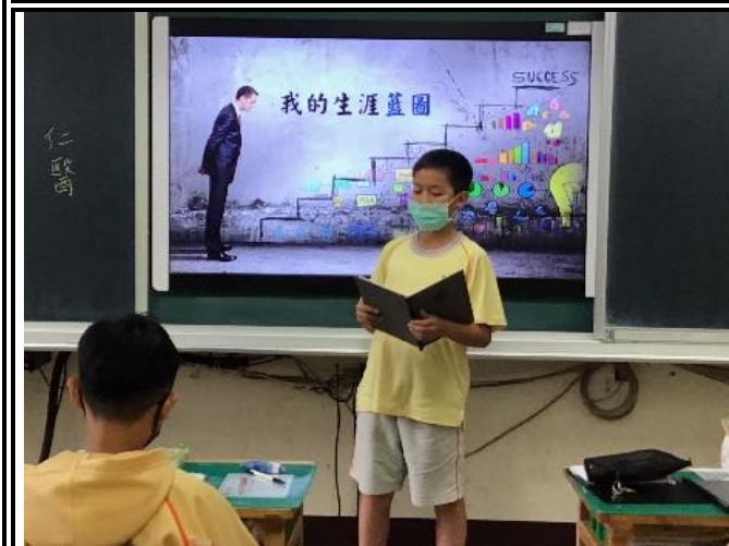
說明：學生自願上台口頭報告(702)