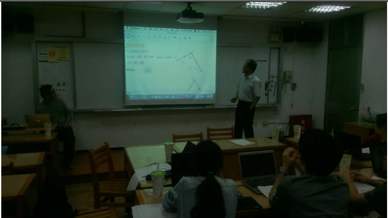
圖二、樞紐定理 GGB 軟體設計 教學討論